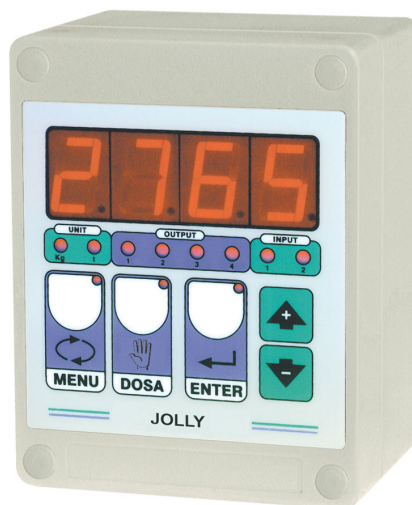
Cassetta per installazione a parete (a richiesta) Grado di protezione IP64