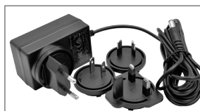
Alimentatore universale 24 VDC/1 A. Ingresso 100÷240 VAC. Lunghezza cavo 3 m.