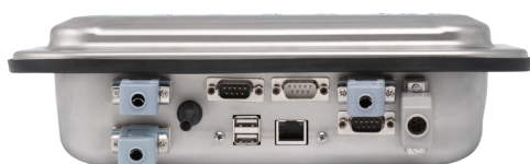
Connettori D-SUB - IP40