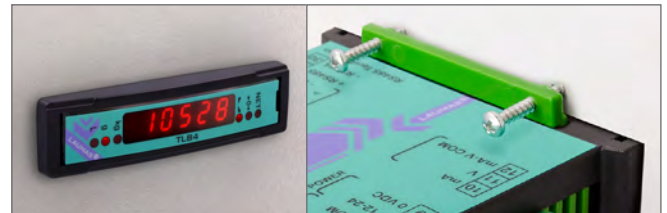
Montage avant tableau (kit de fixation inclus)