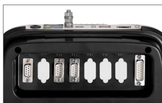
conectores D-SUB - IP40