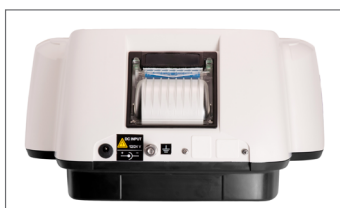
Imprimante thermique intégrée (sur demande)