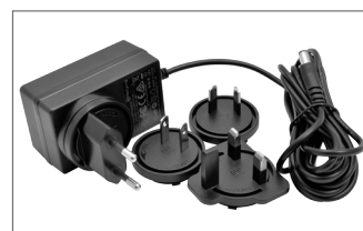
Alimentation universelle incluse 24 VDC/1 A - entrée 100÷240 VAC longueur de câble 3 m