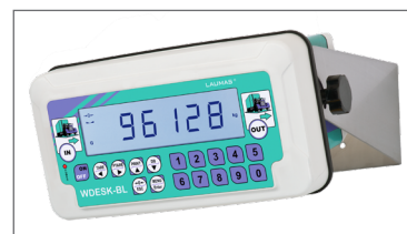
Support en acier inox pour fixation mural (sur demande)