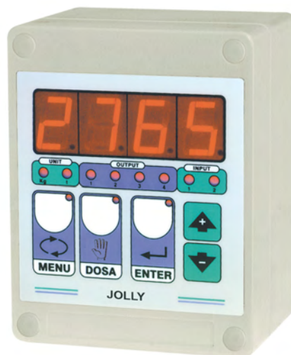
Caja para montaje en pared (bajo pedido) Grado de protección IP64