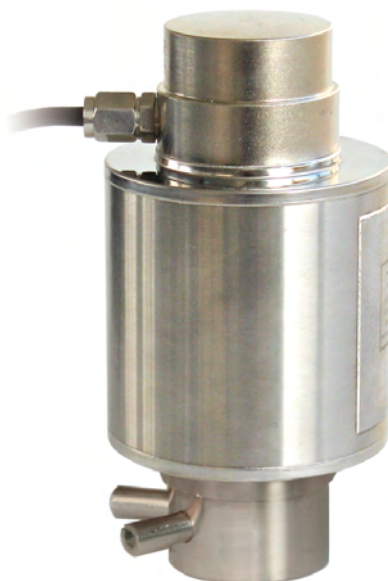
ACCESORIO DE MONTAJE