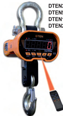
DTEN3 DTEN5 DTEN10 DTEN20