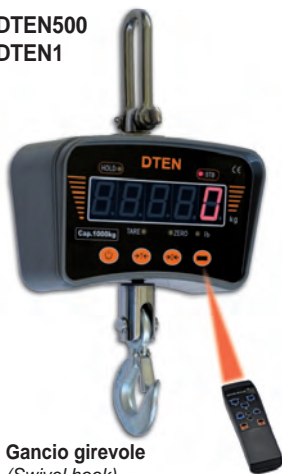
Gancio girevole (Swivel hook)