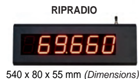
540 x 80 x 55 mm (Dimensions)