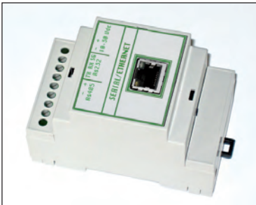
53 x 90 x h 60 mm (Dimensions)