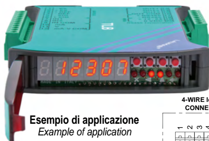
Esempio di applicazione Example of application